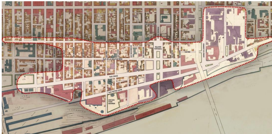
Quartier disparu entre les années 1960 et 1980 (carte de 1949)

À la fin du 19 e siècle, avec l'arrivée du chemin de fer dans le port, la construction d'un lien s'impose afin de relier le port au reste du quartier. La topographie aidant, un tunnel est construit en 1895 dans l'axe de la rue Beaudry, entre la rue Craig et la rue du Port. Le tunnel sera définitivement fermé dans les années 70. Bien que l'état général de l'ouvrage soit aujourd'hui jugé critique, il est recommandé de maintenir, dans l'axe des anciennes rues du quartier, des passages piétonniers non construits. Le tunnel étant situé dans l'axe de l'ancienne rue Beaudry, cette zone de non-construction hors sol permet d'envisager la sauvegarde d'une partie de l'ouvrage, notamment par une occupation inventive de l'espace.