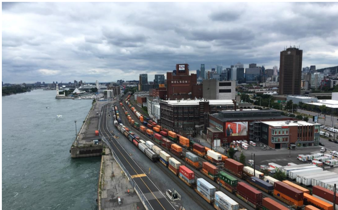
Vue du pont Jacques-Cartier - sites Molson-Coors et Radio-Canada