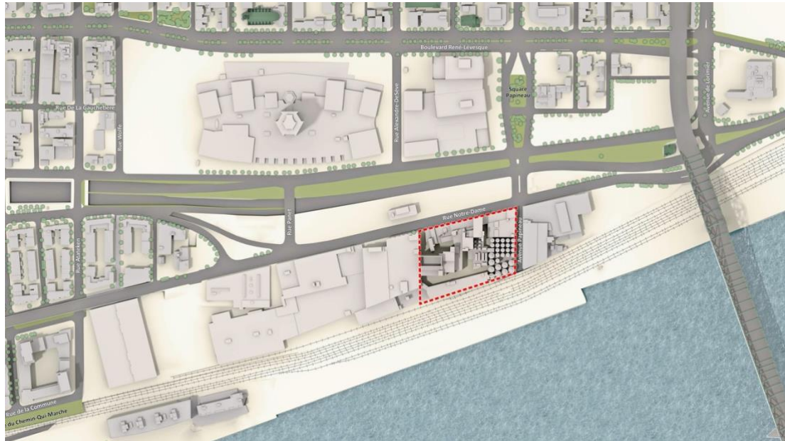
Ilot des Voltigeurs - site fondateur de la Brasserie Molson

site par la reconstitution des espaces publics et la reconversion de l'îlot des Voltigeurs, soit la portion considérée comme étant le site fondateur de la brasserie.