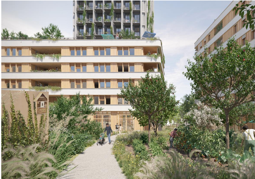
Au cœur de l'îlot, un jardin productif verra le jour