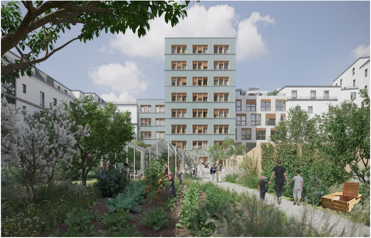
Le bâtiment Latarjet où sera installée la Maison médicale de 2700 m 2

Il proposera des espaces de bureaux polyvalents, le plus flexibles possible et adaptables, qui permettront d'accueillir des locaux de soins, des lieux d'échanges, d'accueil, de conférences, de conseils, de travail et de recherche.