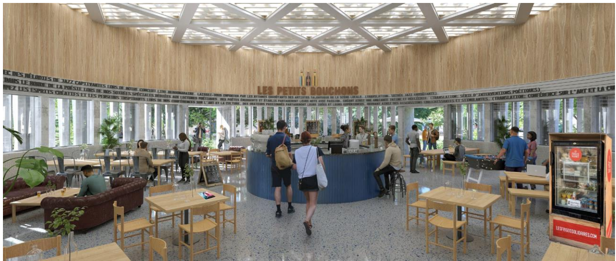
Les Petits Bouchons, un tiers-lieu vivant et animé

L'idée est de laisser les utilisateurs s'approprier les lieux. Un des publics cibles est celui des étudiants, qui pourront travailler dans l'espace de coworking installé au sein de l'allée rénovée entre l'auditorium et la tour. D'autres associations pourront venir occuper les locaux pour un évènement, les habitants et associations du quartier pourront organiser des réunions ou des moments festifs.