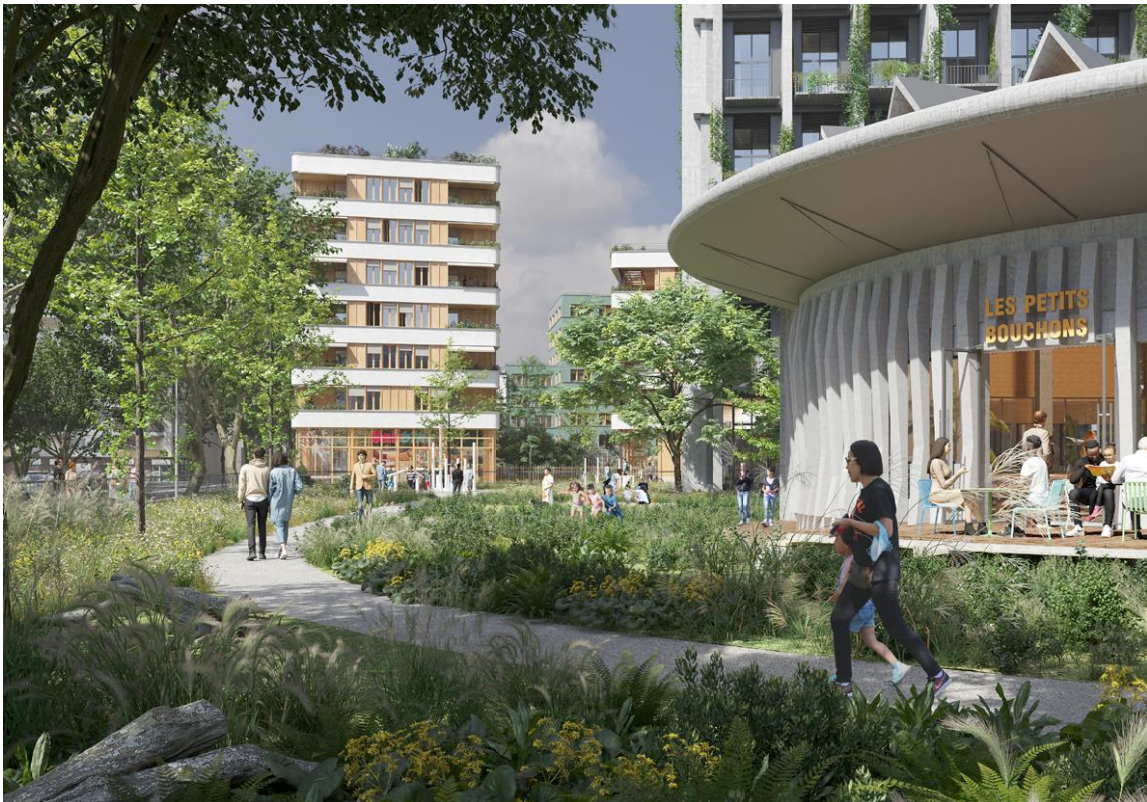
Le site offrira 6000 m 2 d'espaces végétalisés

Sur l'ensemble du site, ce sont 40% des surfaces de pleine terre qui ainsi seront retrouvées favorisant la biodiversité et le vivant et offrant aux habitants un nouvel îlot de fraîcheur dans un quartier carencé.