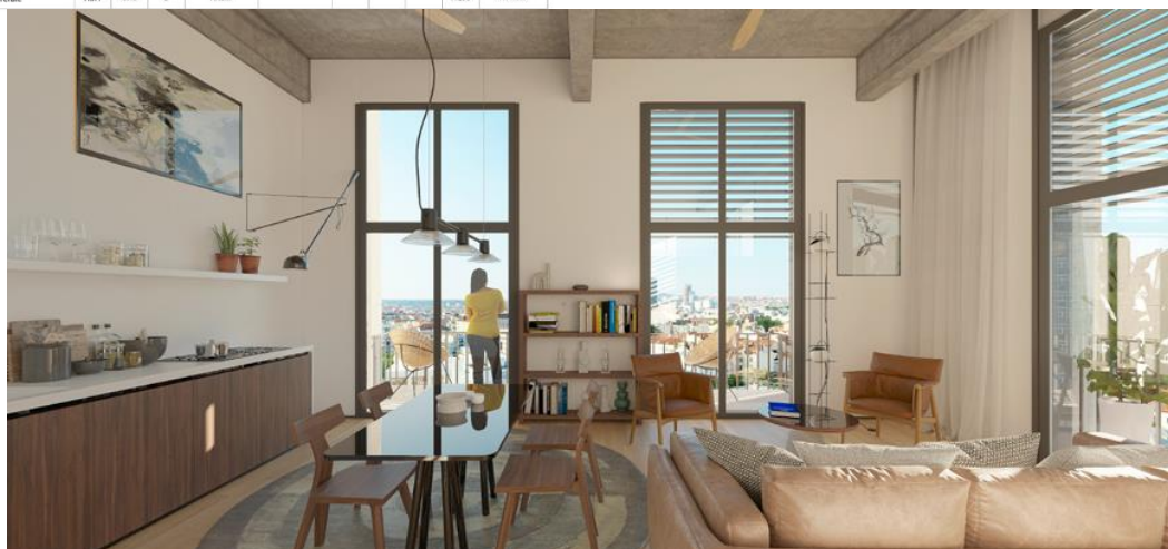
Vue depuis l'intérieur d'un logement de la tour

4 900m 2 de la tour seront consacrés à la réalisation de logements. En simplex et en duplex, dans l'esprit des canuts, au total ce sont 66 logements qui seront proposés en accession libre et en logement social dont une partie sera réservée pour des personnes en situation de handicap , accompagnées par l'ADAPEI 69 et seront gérés par Lyon Métropole Habitat.